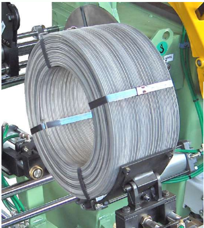
Bobina Prodotta Ended Coil Bobina Producida